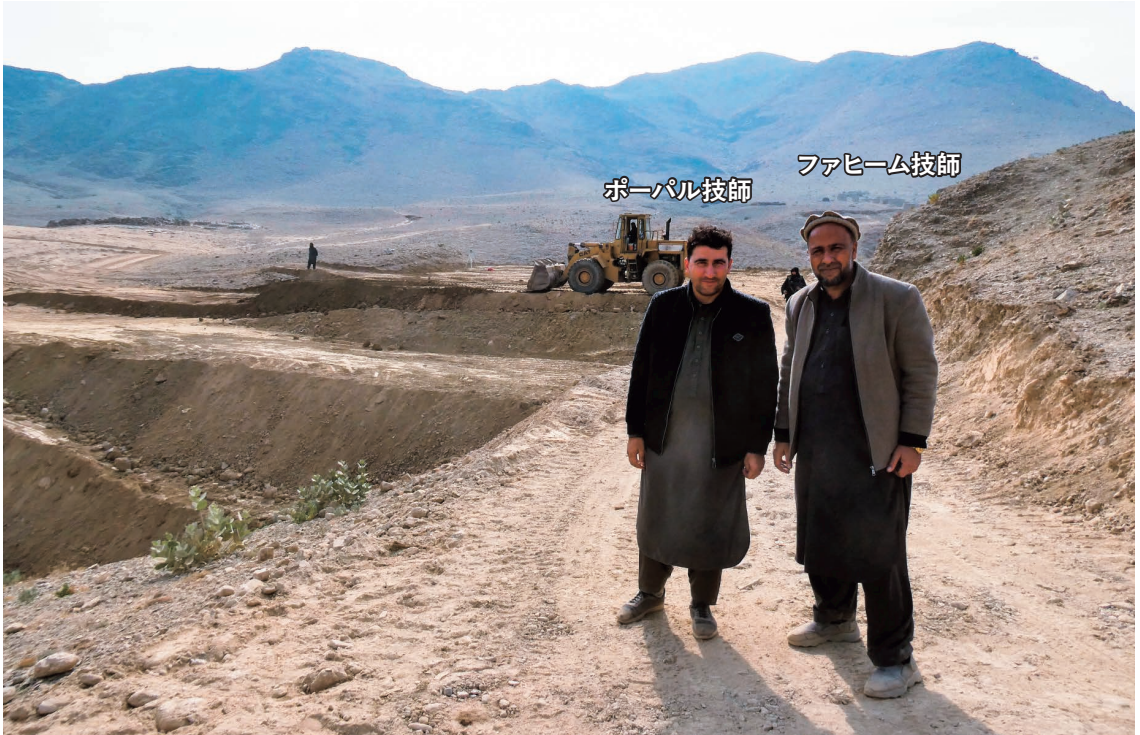
ナー吉安事業では、トールノウ谷、ホラガイ谷、ギーダルノウ谷という複数の谷で砂防堤の建設に取り組み、降雨後に流れ下る鉄砲水の緩流化と貯水を図っている。砂防堤は若手のポーパール技師が担当。(2025年12月13日)