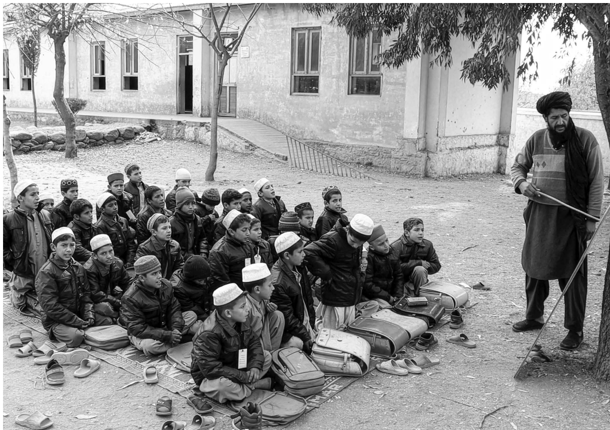
[写真] 被災地でも授業は続く (2025年12月9日)

〈URL〉 https://www.peshawar-pms.com/ 〈E-mail〉 peshawar@kkh.biglobe.ne.jp